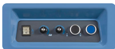
Panneau de contrôle